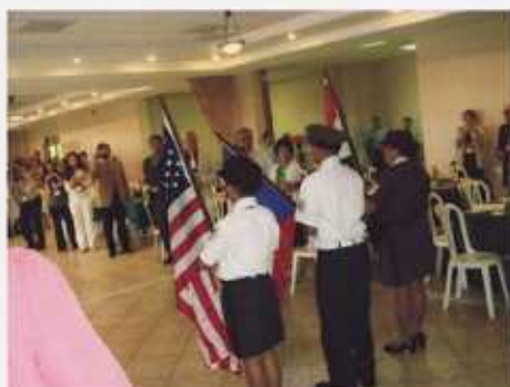
開会式 この後各国入場