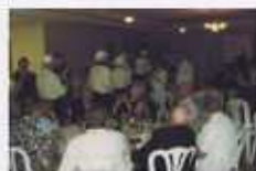
だんだん盛り上が