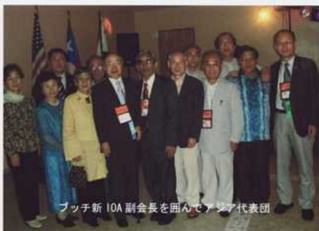
ブッチ新 IOA 副会長を囲んでアジア代表团