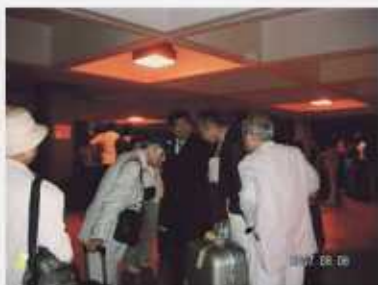
24時間の長旅でした サンファン空港にて