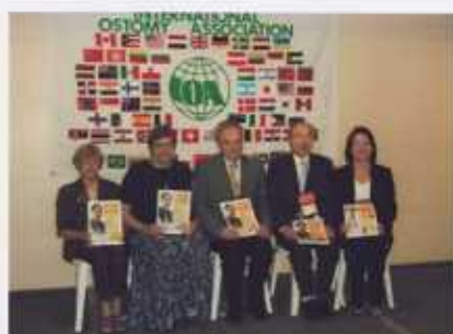
オストミービジターガイドラインの発表