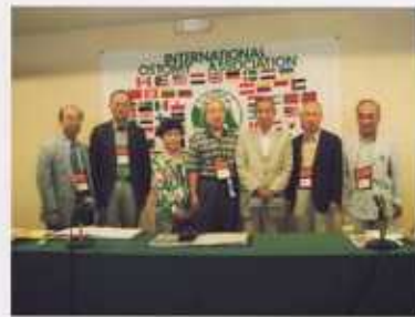
日本からの参加者