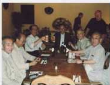
Fajardo Inn に到着 メキシコ料理で遅い夕食