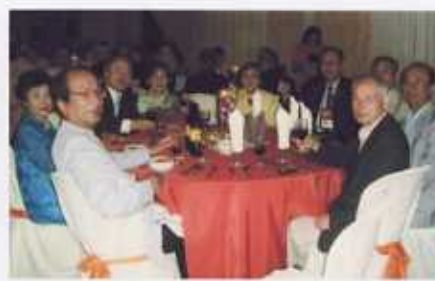
Welcome Dinner 日本代表団