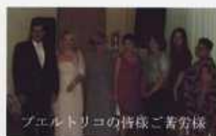
プエルトリコの俳優ご苦労様