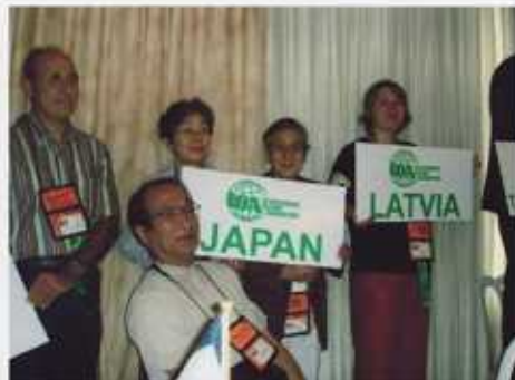
日本代表団も入場