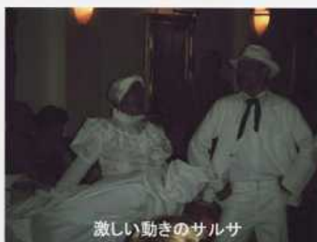
激しい動きのサルサ