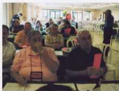
World Council Meeting 採決集計中