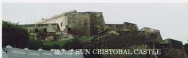
観光地 SUN CRISTOBAL CASTLE