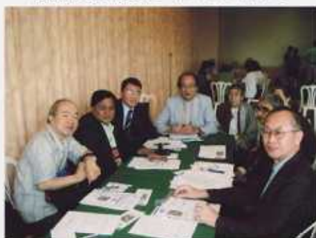
第1日 AOA Meeting