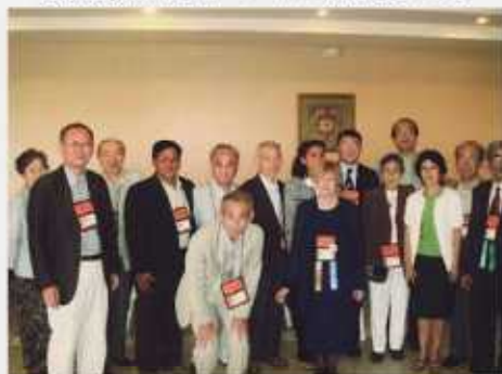
IOA 会長とアジアからの参加者