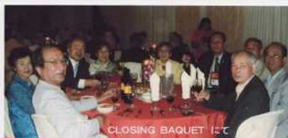
CLOSING BAQUET にて