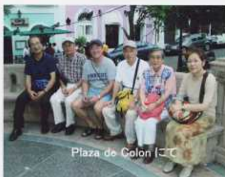
Piazza de Colon にて