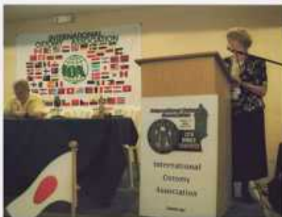
World Council Meeting