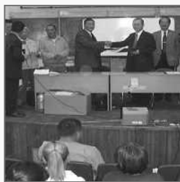
MOAへ訪問団派遣 Sending Delegates to MOA

ここでは、現在 JOA が重点的に取り組んでいる課題のうち、最も重要なもの 3 点についてご紹介します。