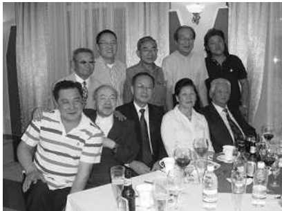
JOA 主催レセプション MOA 幹部と共に